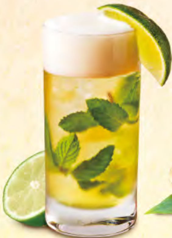
モヒートビア ビール×ジンジャーエール ライム×ミント ¥700