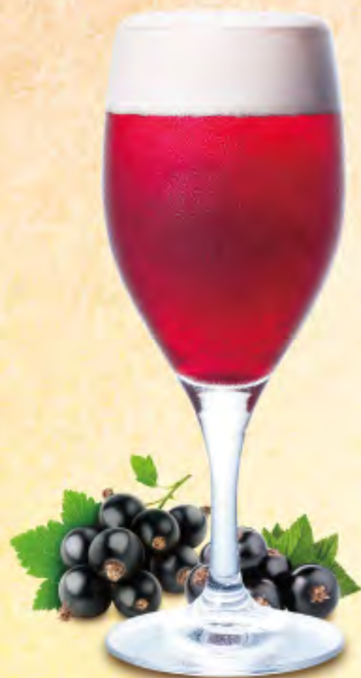
カシスビア ビール×クリームドカシス ¥700