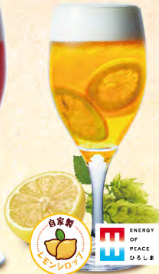
パナシェ ビール× 自家製レモンシロップ ¥700