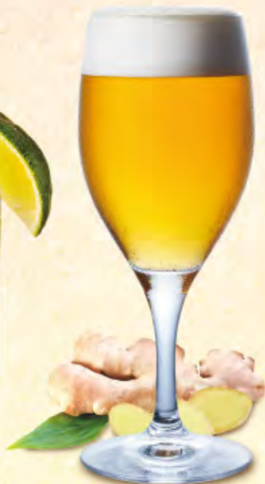
シャンディガフ ビール×ジンジャーエール ¥700