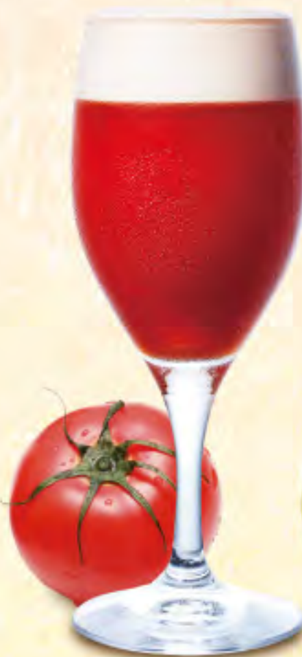
レッドアイ ビール×トマトジュース ¥700